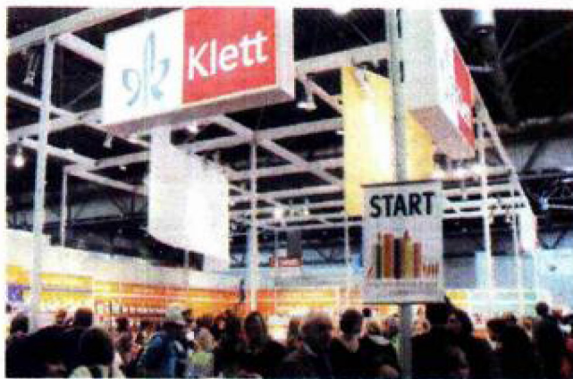
Međunarodni sajam knjiga u Leipzigu je jedno od najvećih strukovnih okupljanja na svijetu

Hrvatska, čija se književnost 2008. nalazila u središtu događaja Leipziškog sajma knjiga, ove godine nastupa sa